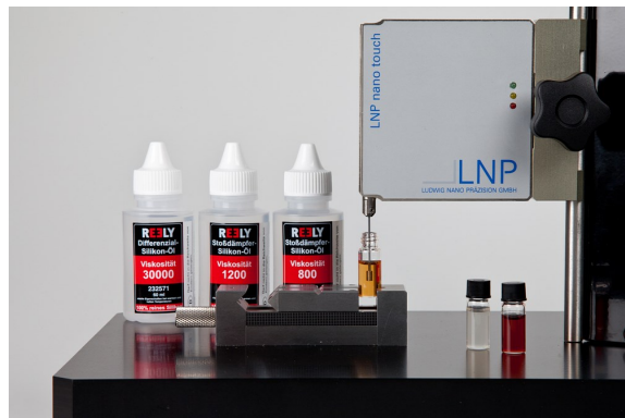
Viskositätsmessung mit LNP Nano touch