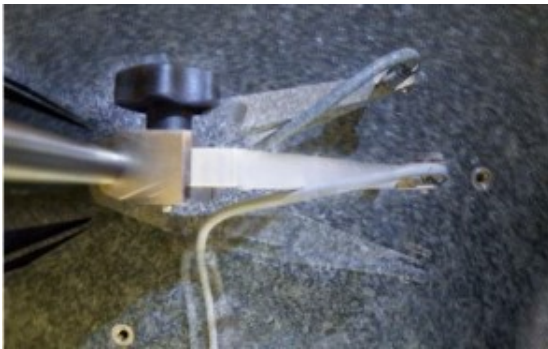
Schwenkbereich der Schnellbefestigung

Diese wichtigen Eigenschaften werden vor allen durch die innovative Dreiecksform gewährleistet. Unser Produkt zeichnet sich aus durch die besonders hohe Biegefestigkeit und eine schwenkbare stufenlose Schnellbefestigung.